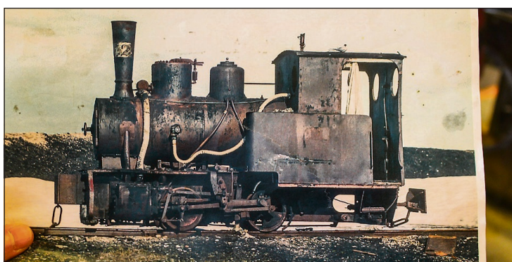
LOKKET: Susan Barr tok dette bildet i 1979. Nå etterlyses foto av skiltplate fra Borsig-lok fra 1909.