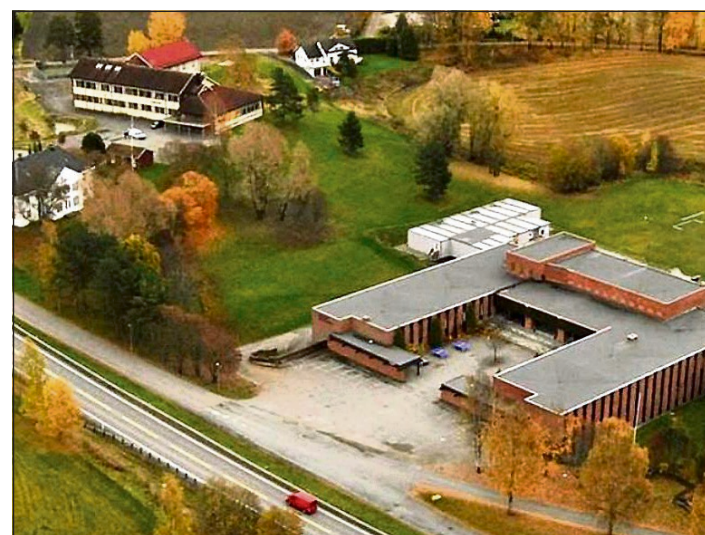
SKOLETOMT: Dagens ungdomsskole i Vormsund skal erstattes med ny skole i bakgrunnen til venstre.